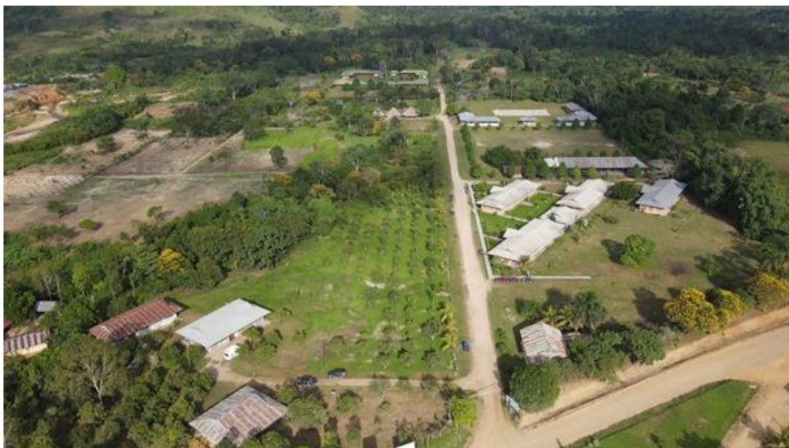
Vista aérea del albergue de Nopoki en la Atalaya.

Este proyecto, con el que colaboramos desde nuestra asociación Zapallal aportando 8.000,00 euros, tiene una ejecución en el tiempo de tres meses, desde septiembre a noviembre 2022.